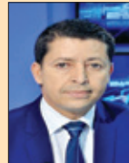
Faycel KHÉMIRI Général brigadier

خريج الأكاديمية العسكرية 1992 مدير مدرسة حرس المرور 1997-2004 خريج المدرسة العليا لقوات الأمن الداخلي 2000 مدير إدارة الدراسات والمعطيات بالمرصد الوطني لسلامة المرور